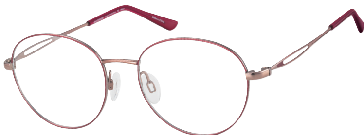
CH 29821 RE

■ Rode, paarse, groene en beige randen (CH29821) zorgen voor subtiele accenten.