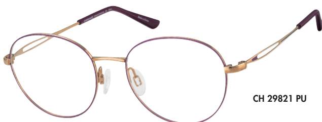
CH 29821 PU

■ Voor een meer dynamische verschijning, maakt dit vierkante oversized montuur (CH29824) een opvallende indruk. De decoratie op de bèta-titanium veren is geïnspireerd door juwelen.