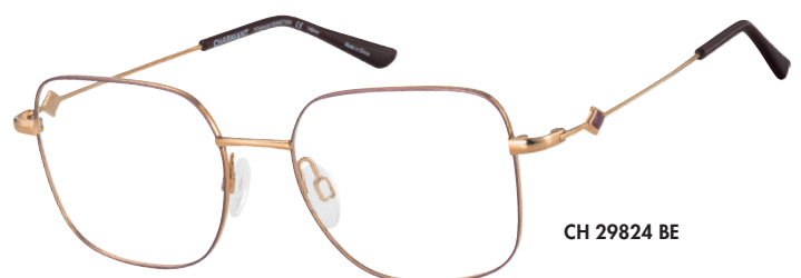
CH 29824 BE