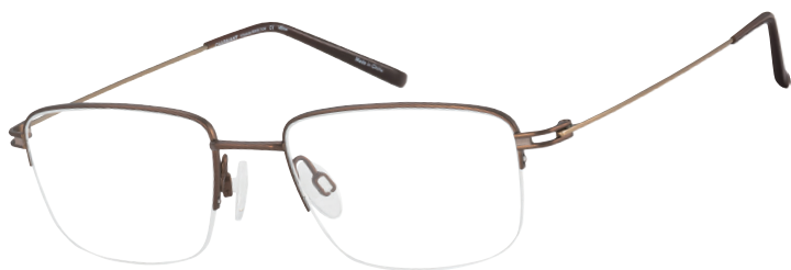
CH 29721 BR

Tijdloze elegantie en superieure gewichtloosheid worden bij deze herenmonturen versterkt door ultradunne veren van flexibel bèta-titanium.