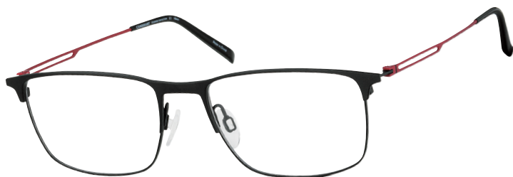
CH 29719 BK

Deze herenmonturen zijn een pure uitdrukking van CHARMANT Titanium Perfection hightech designprecisie.