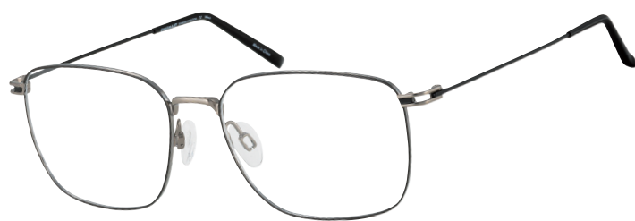
CH 29722 LG

■ De smalle opening in de hoekstukken van dit opvallende nylon montuur (CH29721) zorgen voor nog meer lichtheid.