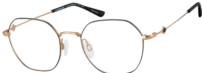
CH 29823 BK

■ Dit opvallende geometrische model (CH29823) accentueert elk gezicht dankzij de moderne kleuren, de achthoekige vorm en de kleurrijke details op de veren.