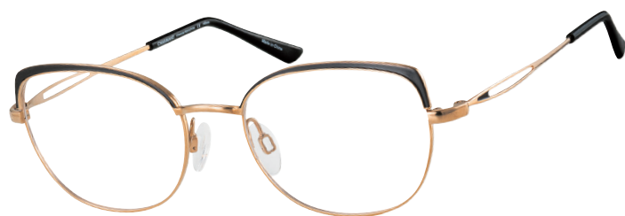
CH 29820 BK

■ Deze sensuele look (CH29820) gaat nog een stap verder met de focus op de ogen dankzij de opvallende accenten op de bovenranden in de tinten rood, zwart, beige en violet. Slanke veren en openingen zorgen voor een echt statement.