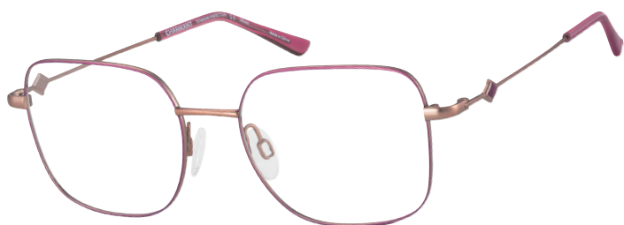
CH 29824 PK

■ Dit vierkante montuur (CH29824) gebruikt kleuren als paars, roze, beige en grijs om de ogen te benadrukken en elegantie en eenvoud te onderstrepen.