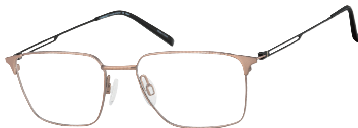
CH 29720 GD

■ Dit symmetrische, volledig omrande model heeft een discrete wenkbrauwlijn en geometrische openingen in de veren van bèta-titanium (CH29719).