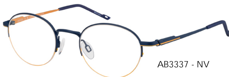
AB3337 - NV