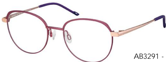
AB3291 - PK

Moderne kleuren, gradiënteffecten op de veren en een chic 3D-design maken deze driekleurige Ad Lib damesmonturen heel uniek. Het volumespel op de voorkant en het contrast tussen matte en glanzende afwerkingen onderscheiden het vrouwelijke zeshoekige model (AB3290). Voor een zachtere indruk voegt het afgeronde oversized model (AB3291) een aantrekkelijk accent toe.