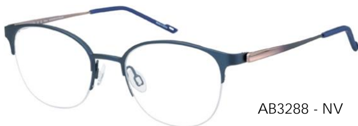
AB3288 - NV

Discrete, vrouwelijke glamour ontmoet high-tech elegantie in deze damesbril van Ad Lib. Het opvallende panto-model (AB3288) maakt indruk met kleurverlopen op de veren en stijlvolle mat en glanzende contrasten. Dit ronde zeshoekige model (AB3289) is prachtig met de metallic kleuren, kleurovergangen en matglanzende contrasten. Beide modellen worden geaccentueerd door een 3D detail op de veer en zijn uitgerust met flexibele bèta titanium veren.