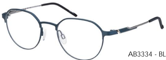
AB3334 - BL