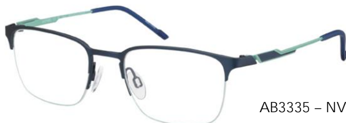
AB3335 - NV

Deze zelfverzekerde en dynamische bril met geometrisch pantovorm (AB3334) of de retro rechthoekige vorm (AB3335) heeft een moderne en sportieve look. De veren zijn slank met dynamisch volumespel dat een gestructureerd 3D-effect creëert. Tweekleurige contrasten, matte en glanzende applicaties en gekleurde nylordraden benadrukken de sportieve look.