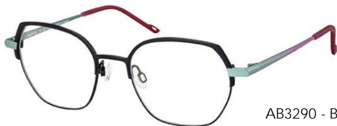
AB3290 - BK