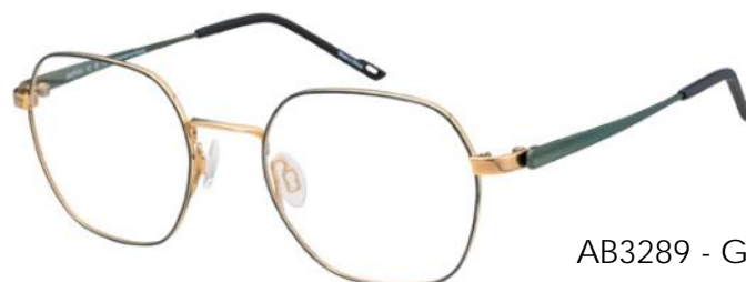
AB3289 - GN