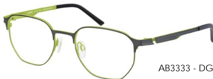
AB3333 - DG