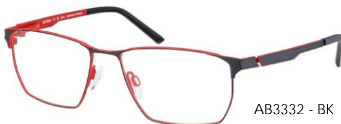
AB3332 - BK

Het progressieve ontwerp maakt van deze levendige, moderne bril een absolute topper. Het volumespel in het moderne rechthoekige model (AB3332) en de vierkante variant (AB3333) creëert een sterk 3D-effect dat wordt versterkt door levendige kleurcontrasten. Een scharnier van bèta titanium optimaliseert de flexibiliteit van de veren.