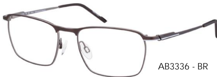
AB3336 - BR

City cool ontmoet snelheid met deze opvallende volrand rechthoekige (AB3336) of iconische ronde (AB3337) modellen. De dunne, gestroomlijnde profielen, dynamische 3D-details en levendige kleurtoepassingen zorgen voor extra energie.