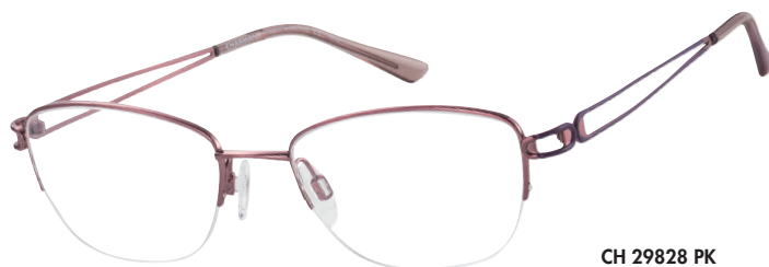
CH 29828 PK