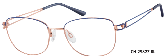
CH 29827 BL

■ Tijdloos, exclusief, chic - deze CHARMANT Titanium Perfection brillen in klassieke en moderne tinten zijn perfect voor zakelijke bijeenkomsten en formele gelegenheden. De slanke, randloze look (CH29829) staat prachtig bij het gezicht, terwijl gekleurde veren een verleidelijke accent toevoegen. Een geraffineerd volrand montuur (CH29827) en een slank nylon model (CH29828) hebben een fijne tweedelige veer die de lichtheid benadrukt.