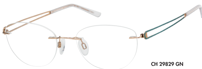
CH 29829 GN