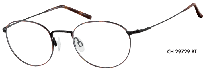
CH 29729 BT