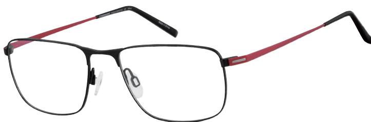
CH 29726 BK

Deze herenbril (CH29726) is een echte klassieker. Het combineert een duurzaam mannelijk profiel met een verfijnde verhoogde brug en diagonale, uit één stuk bestaande veren. Tegelijkertijd straalt het montuur het prestige, het lichte comfort en de kwaliteit van het merk CHARMANT Titanium Perfection uit.