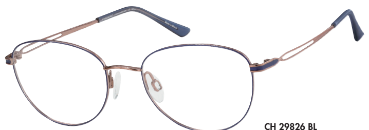
CH 29826 BL