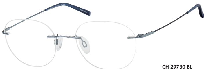
CH 29730 BL