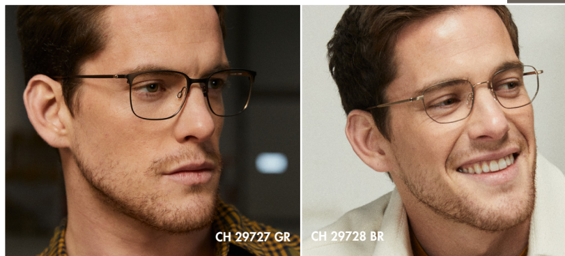
CH 29727 GR