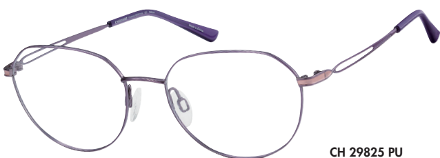
CH 29825 PU

Deze verfijnde brillen (CH29825 en CH29826) zijn een zacht modieuze interpretatie van de CHARMANT Titanium Perfection look. Vrouwelijke randen in panto en ronde vormen flatteren de ogen en het gezicht, terwijl sierlijke veren met luchtige uitsnijdingen en frisse kleuren voor een modieus accent zorgen.