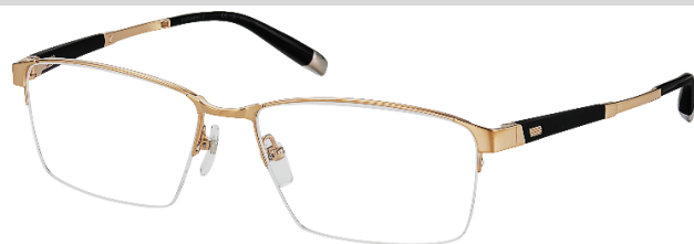
ZT27071 / ZT27072

Dit aantrekkelijke CHARMANT Z montuur met halve rand getuigt van een moderne ontwerpstyl en inventieve techniek. De veren hebben een constructie van titanium en harsdelen met een Z-titanium kern voor een optimale pasvorm. Deze vierkante look schittert in luxueuze tinten en is voorzien van een gegraveerd Z-logo aan de binnenkant van de veren.